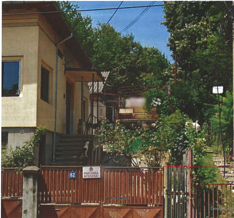
Imobilul care face obiectul studiului de impact