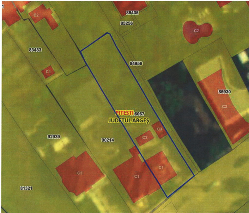
Amplasarea adaposturilor –padocurilor pentru caini in imobilul din str. Trivale 62